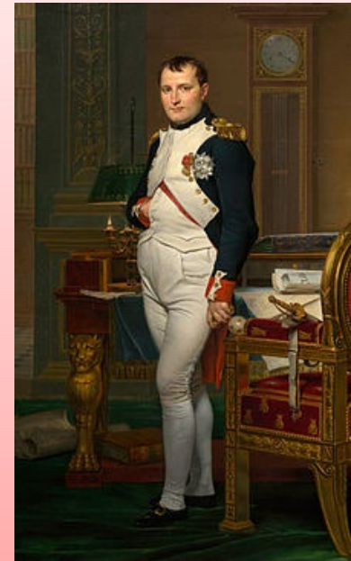
Napoléon 1 er en 1812.