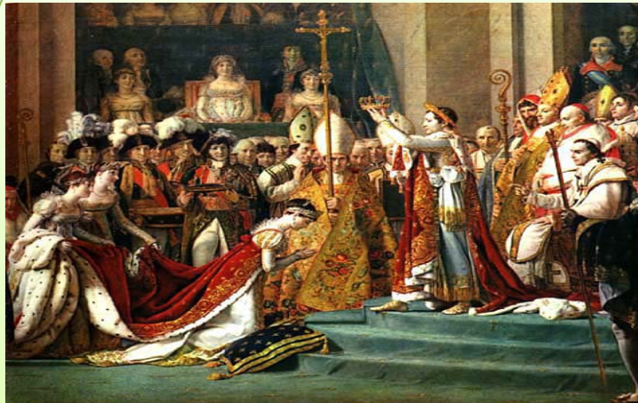
Le Sacre de Napoléon 1 er en 1804