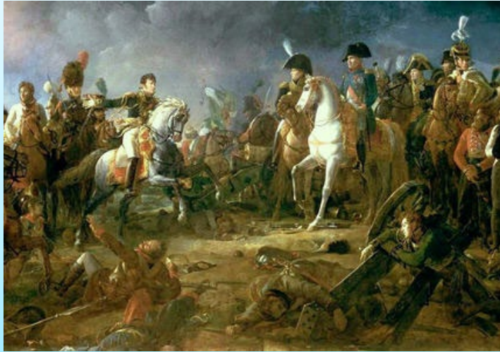
Napoléon victorieux à Austerlitz. 1804

Napoléon dispose de l'armée la plus nombreuse d'Europe qu'il commande lui-même aidé d'habiles généraux. Il veut conquérir l'Europe afin de diffuser les idées de la Révolution Française. Ses soldats le vénèrent (ils ont un profond respect pour leur général). Après de nombreuses victoires comme Austerlitz , la France a conquis plus de la moitié de l'Europe. L'Angleterre est isolée.