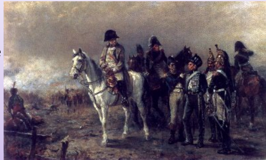
La défaite de Waterloo. 1815.

★ Cependant, une série de défaites (en Espagne, Russie puis en Belgique à Waterloo) l'oblige à abdiquer (abandonner le trône). Napoléon est exilé sur l'île d'Elbe puis assassiné à Sainte-Hélène. La monarchie est rétablie en France et Louis XVIII devient roi de France grâce à l'appui des autres pays européens, heureux de voir disparaître les idées révolutionnaires.