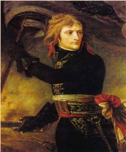
Le général Bonaparte en 1798

A la suite de victoires probantes et devant la crainte des Français de voir revenir un Roi, il se fait sacrer empereur en 1804 et parvient à rassembler tous les Français.